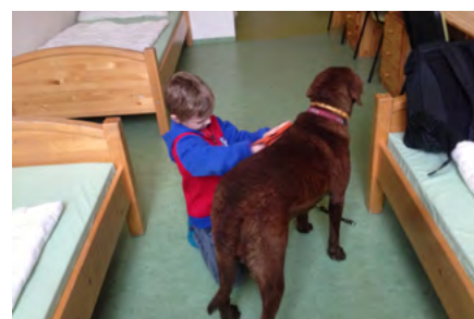
Dětský pacient s dysfázií při cvičení jemné motoriky 1

Ergoterapie je efektivní při řešení problémů v oblastech jako je sebeúcta, sebevědomí, řešení problémů, sociální dovednosti a zvládnání stresu a úzkosti a je schopná pokrýt velký rozsah možností pro pacientův wellbeing.