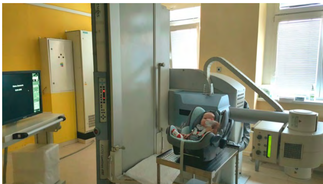
Obrázok 1.: Poloha dieťaťa pri VFSS

Poloha dieťaťa pri VFSS: Dieťa je buď v polosede, sede, alebo stojí. Dojčatá a menšie deti môžu byť v kočíku alebo v autosedačke, väčšie na vozíku alebo v kresle so zabezpečenou správnu postúrou trupu, hlavy a krku (hlava nesmie byť zaklonená) (obr.1). Rozhodne by sme nemali realizovať vyšetřenie tak, aby dieťa držal na rukách rodič.