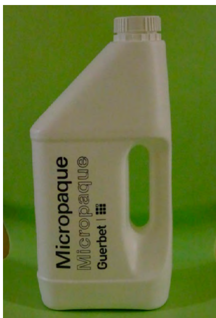
Obrázok 3: Kontrastná látka

Pomôcky na pitie a jedenie počas VFSS a použité konzistencie: kvôli transparentnosti vyšetrenia je dôležité, aby sa počas VFSS použili predmety (fľaša s cumľom, pohár, lyžička), ktorými je dieťa kŕmené doma a aby ho kŕmil človek, ktorý ho kŕmi každý deň. Ako kontrastná látka sa používa nejódová báriová kontrastná látka (obr. 3), ktorá je v prípade aspirácie dieťaťa šetrnejšia voči jeho pľúcam. Ak má dieťa problém so saním z fľaše s cumľom, použijeme striekačku alebo lyžičku. U väčších detí môžeme použiť pohár, alebo aj slamku. Obyčajne sa pri vyšetrení podávajú tri konzistencie: tekutá (mlieko, čaj), kašovitá (jogurt, jablčná výživa a iné výživy) a tuhá (koláč, keks, chlieb).