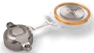
Obrázek 5: Bonebridge – aktivní transkutánní implantát pro kostní vedení, vnitřní část