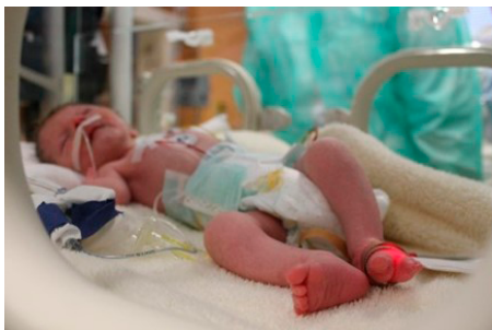
Obrázok 1: Dieťa po narodení

Dieťa sa narodilo z fyziologickej gravidity v 36. gestačnom týždni, pôrodná hmotnosť bola 1 660 gramov, placenta bola fibrotická s infarktami, pôrod bol indikovaný. Popôrodné Apgar skóre bolo 9 z 10. Ihneď po pôrode bola zjavná faciálna a somatická polystigmatizácia s mikrognáciou, rážštepom uvuly, ektroméliou (znetvorenie jednej alebo viacerých končatín, prípadne ich nevyvinutie), nezrelým genitálom a prenatálnou hypotrofiou. Karyotyp bol v norme. Po narodení bol suponovaný u pacientky syndróm Cornelia de Lange. Tento vzácny syndróm bol následne verifikovaný genetickým vyšetrením. Okrem vyššie uvedených znakov ochorenia u pacientky bola verifikovaná bilaterálna percepčná porucha sluchu stredne ťažkého stupňa kompenzovaná naslúchacím aparátom, mikrokránium a inkontinencia.